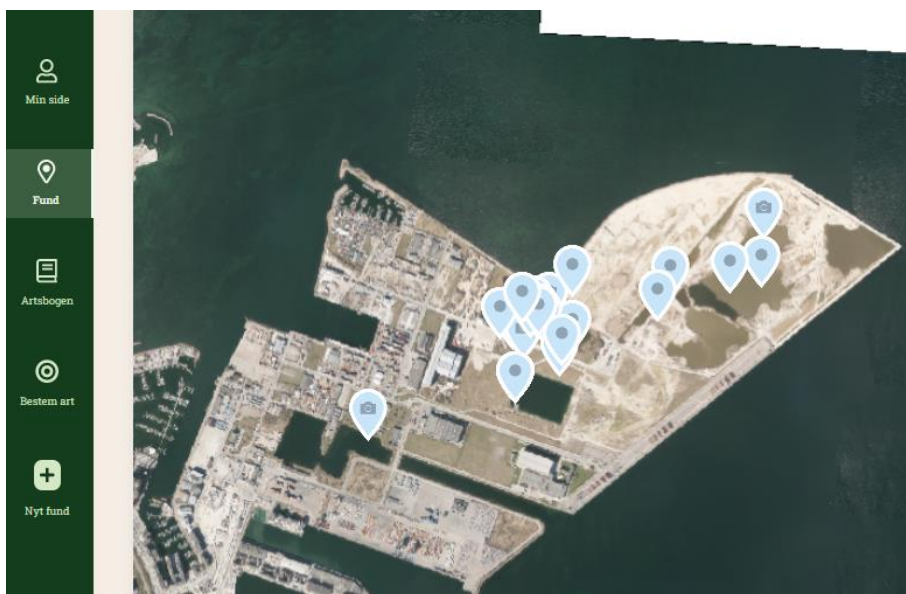
Figur 2. Fund af grønbroget tudse i Nordhavn, som er offentliggjort på arter.dk. Fundene omfatter såvel resultatet af professionel naturovervågning (Amphi Consult for Miljøstyrelsen) som borgerfund. Nogle af fundene er afsat noget upræcist i forhold til det aktuelle fundsted, og der nogle af forfatteren kendte ynglestedsfund, som ikke er vist på kortet. De nyeste fund er fra 2021.

Rambøll må antages at have været bekendt med forekomst af grønbroget tudse i Nordhavn, da dette fremgår af Danmarks Miljøportal. Desuden har både Københavns Kommune og By & Havn (Rambølls kunde) gennemført monitoring af paddebestande i Nordhavn igennem en årrække. Resultaterne heraf fremgår hverken af tekst eller referenceliste i miljøkonsekvensrapporten. Det må på den baggrund antages, at man ikke har fundet det relevant at forholde sig til denne bestand.