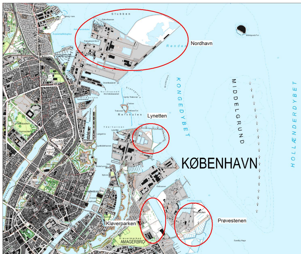
Figur 3. Bekræftede forekomstmråder for grønbroget tudse i Københavns Havn i perioden 2020-2021.

Det overlades til jura-kyndig ekspertise at afklare placeringen af myndighedskompetencer i forhold til Lynetteholm. Umiddelbart må det dog forventes, at Staten ved administration af de internationale beskyttelsesbestemmelser er forpligtet til at overholde de samme kvalitetskrav som underordnede myndigheder.